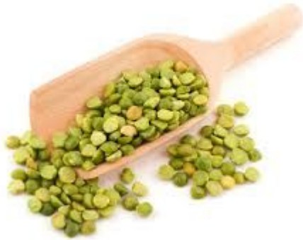
Les Pois cassés