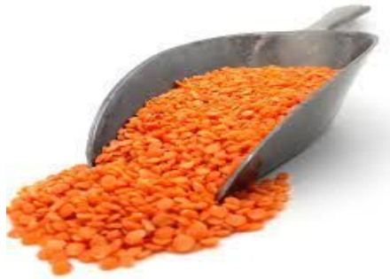
Les Lentilles Corail